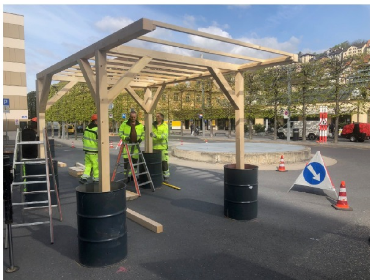
Une pergola se dressera au sud du giratoire.

Amélioration de la convivialité? Elle transparaît dans la pergola en bois dont l'édification a commencé au sud du giratoire de la gare.